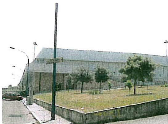
Vista da via Miccoli da nord-ovest